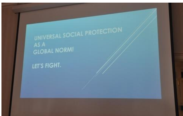
Le symposium organisé conjointement par l'Association internationale des écoles de

travail social et le Conseil international de la protection sociale visait à discuter du lien entre l'éducation au travail social et les pratiques de développement social. Vous trouverez ci-dessous des résumés des discussions qui ont eu lieu lors du symposium.