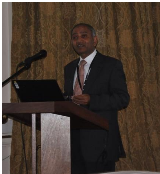
Professor Manohar Pawar

significatives entre les deux. Le professeur Pawar a fait valoir que les idées et les idéaux du développement social sont universellement applicables ; le développement social est pratique et il est possible de pratiquer et de réaliser le développement social ; les aspects sociaux et économiques ne se font pas concurrence, car le développement économique est l'une des dimensions cruciales du développement social ; et le développement social est global, flexible et évolutif. Ensemble, le développement social et le travail social peuvent se développer.