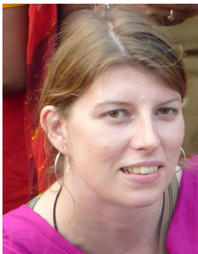
La Dra. Julie Newton es Alta Consejera en el Royal Tropical Institute de Ámsterdam.

perspectiva de género en la protección social y resaltaré cómo las políticas de protección social con perspectiva de género pueden arraigar las desigualdades de género. Además, demostraré cómo la atención al género en el diseño de los programas de protección social puede mejorar su efectividad para lograr un desarrollo más inclusivo.