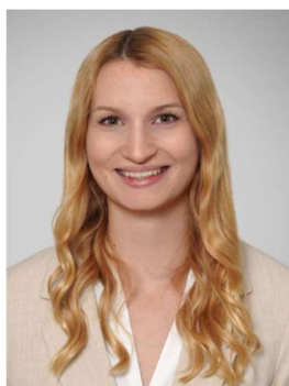
Merle Treichel, Ministerio Federal de Asuntos Sociales, Sanidad, Asistencia y Protección del Consumidor de Austria.

Al igual que en otros países, en Austria, la evolución demográfica y sociopolítica está provocando cambios estructurales en el sistema de atención a largo plazo. Los enfoques preventivos y de promoción de la salud son necesarios para mejorar la salud de la población austríaca, especialmente entre los grupos