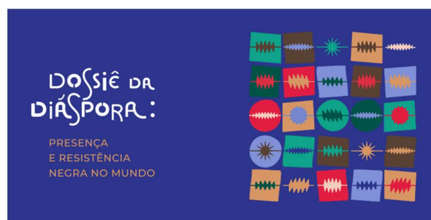
Dossier de la diáspora

El proyecto "Resistencia en el Mundo" se centró en la influencia de los negros de la diáspora africana en la ciencia, la cultura y el arte en todo el mundo.