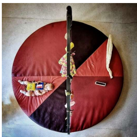
Espacio de Juego

Su acción continua proporciona un ambiente lúdico permanente o temporal con un escenario diseñado para apreciar el juego, ya sea espontáneo, guiado o mediado. Está destinado a recibir y promover la convivencia con todo tipo de vínculos: familiares, afectivos, escolares, entre otros. El ambiente está preparado por educadores que movilizan diferentes posibilidades de montajes educativos y lúdicos, seleccionando elementos lúdicos y colecciones para propiciar una experiencia única para cada individuo o colectivo.