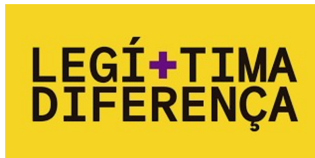
Dossier de la diáspora

experiencias en diferentes espacios sociales, los derechos, la representación en las artes y la aceptación familiar.