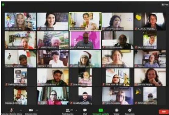
Talleres por Zoom

La comunidad ha sido muy activa en esto. El hecho de que sean actividades virtuales, facilitó la participación de personas de distintas partes del país y del mundo, convirtiéndose en un espacio de debate con asociaciones de otros países.