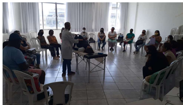
clase de cuidador de mayo de 2022

Otro trabajo importante son los encuentros Mundo de Conocimiento y Sociedad: Desafíos y Posibilidades. El CBCISS y el SESC São Paulo organizan estas actividades en estrecha proximidad, seleccionando los temas que serán abordados, así como los expositores participantes.