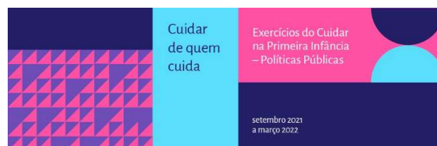
Cuidando el ciclo de los cuidadores

En ese sentido, la acción Cuidar a los Cuidadores ya está en su 4ª edición, que tiene por tema Ejercicios de Cuidado en la Primera Infancia—Políticas Públicas. Su objetivo es ampliar el alcance de las perspectivas democráticas y ciudadanas como dimensiones de la calidad de la atención a través de miradas transversales y multidisciplinares en la formulación de políticas públicas.