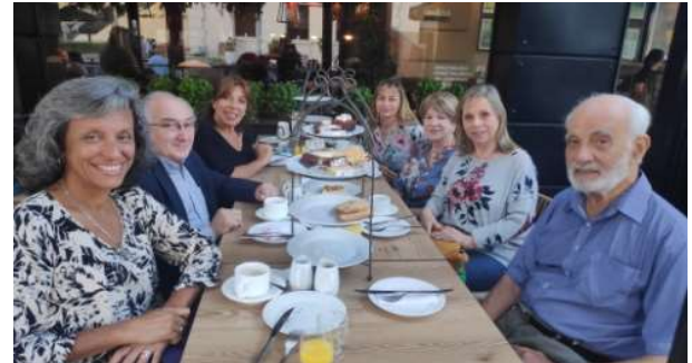
Autoridades del CUBS