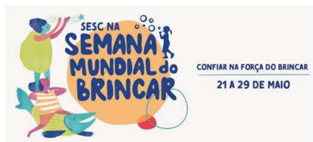
Semana Mundial del Juego

otros actores de todas partes de Brasil, la Semana Mundial del Juego ha ido sucediendo desde 2009, y SESC se ha unido al esfuerzo en 2013. El evento está conectado a la Día Mundial del Juego, celebrado el 28 de mayo, y habla de lo importante que es jugar como fundamento y expresión genuina de los bebés, niños pequeños y niños.