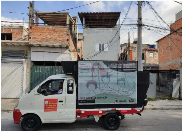
Proyecto de escucha involuntaria

19, en el que un camión circula con los altavoces encendidos, reproduciendo mensajes que abordan el tema de la violencia doméstica, especialmente contra mujeres, niños, y adultos mayores.