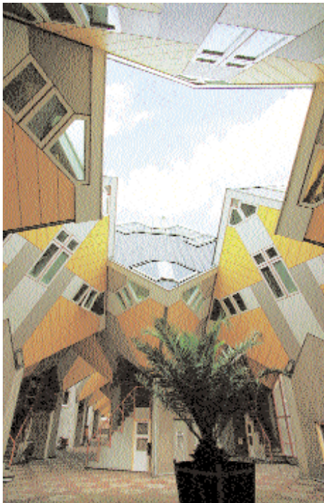
Casa de Cubo, Rotterdam