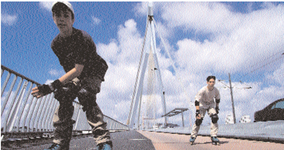
Niños patinando sobre el puente 'Erasmus', Rotterdam

E-mail info@rotterdamroots.nl , www.rotterdamroots.nl