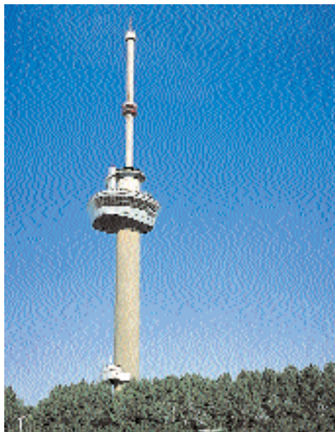
Torre 'Euromast', Rotterdam