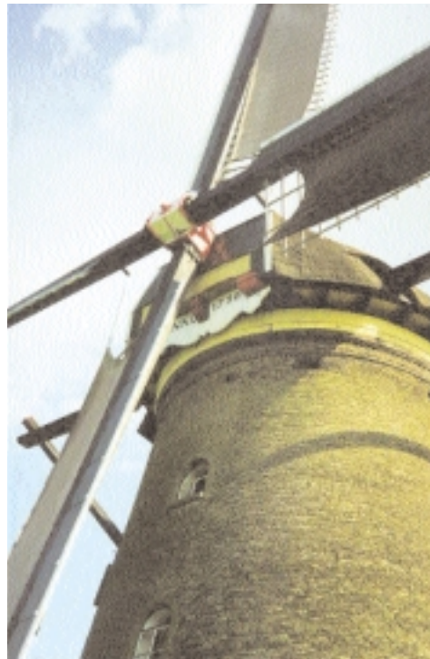
Molino de Viento, Kinderdijk