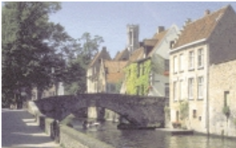
La histórica ciudad de Brujas

Brujas tiene una larga tradición de actividad portuaria internacional y fue famosa en Europa por el arte. Los monumentos de Brujas, los museos y, particularmente, el bien conservado escaparate histórico de la ciudad, atraen a muchos visitantes todos los años. Disfrutará de la ciudad en barco y visitará una fábrica cervecera llamada "De Straffe Hendrick", situada en el corazón de la ciudad histórica. En este exclusivo museo se muestra la centenaria tradición cervecera de Brujas. También tendrá tiempo de pasear por la ciudad a su antojo. Regresaremos al hotel alrededor de las 19.00. Costes por persona: € 57.